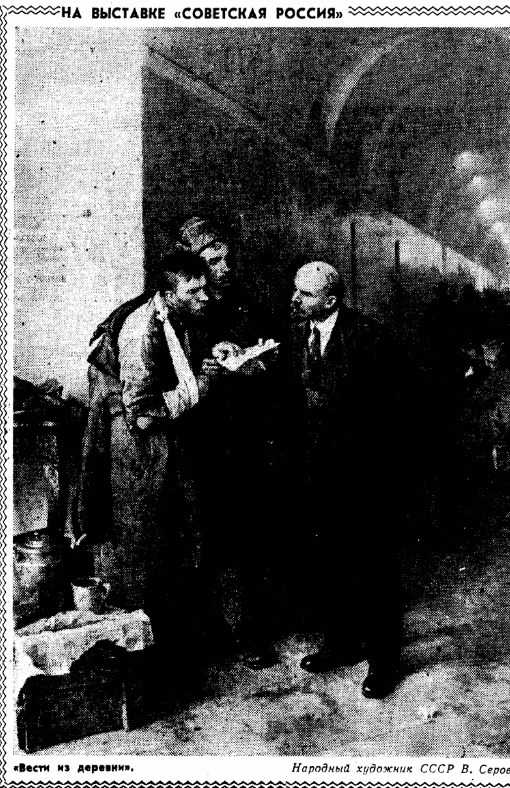
«Вести из деревни».